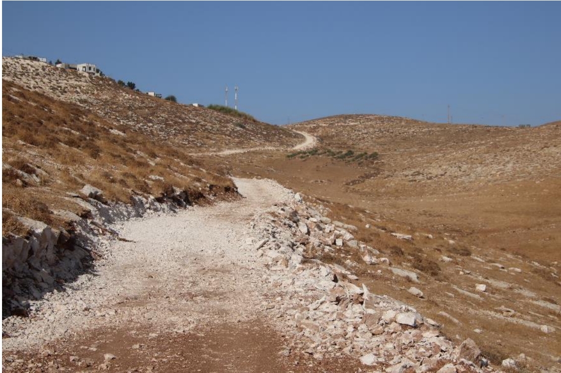
דרך מהמאחז מצפה דני למאחז חוות הארמונות ממערב ליריחו

פריצת דרך על אדמות הכפר א-דיכ. לאחר פריצת הדרך הוקם בסופה המאחז חוות צרדה החדשה