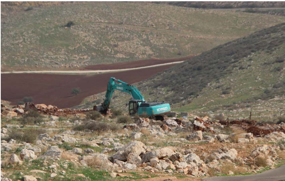
עבודות תשתית מזרחית להתנחלות איתמר