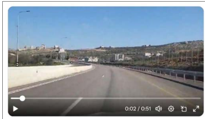
[סרטון כביש עוקף חווארה] , יותר מ 300 מיליון שקל לכביש כמעט ריק מתנועה