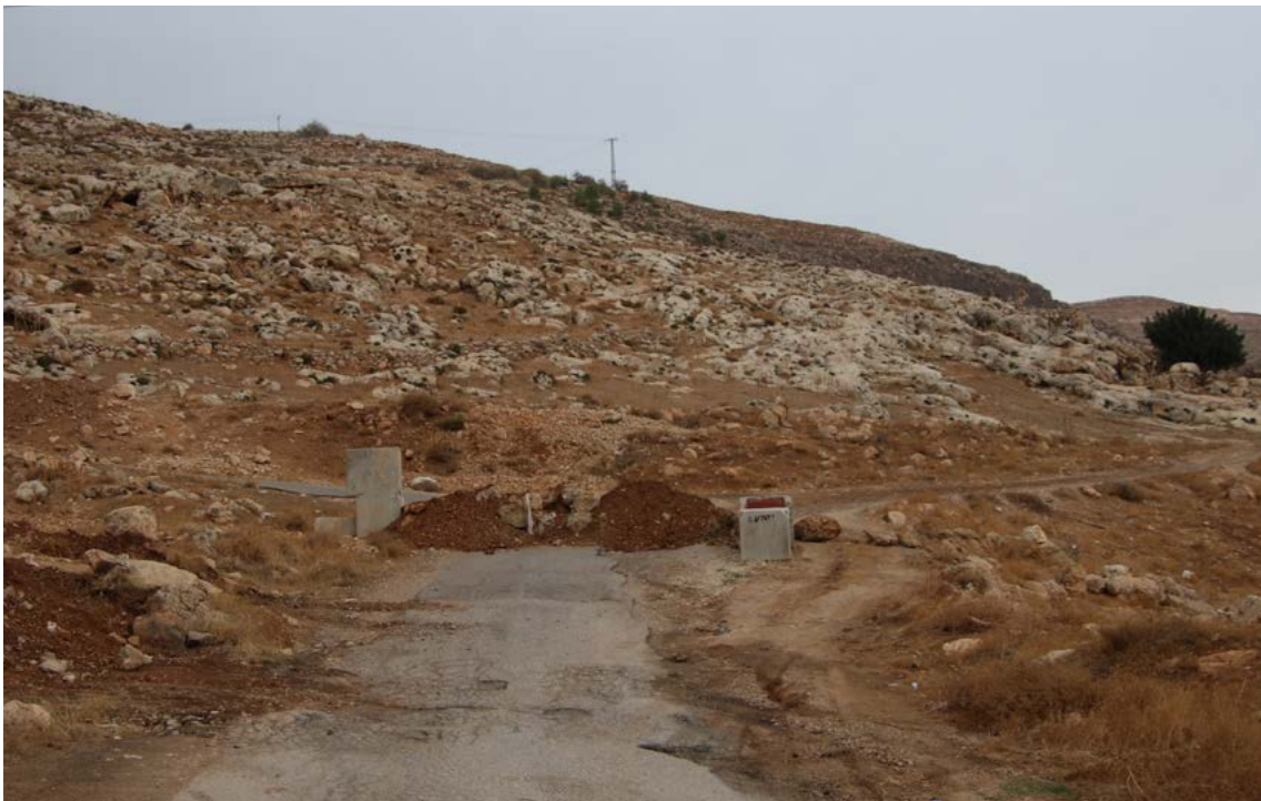
חסימת הכניסה לכפר עין סמיה, צפונית מזרחית לרמאללה