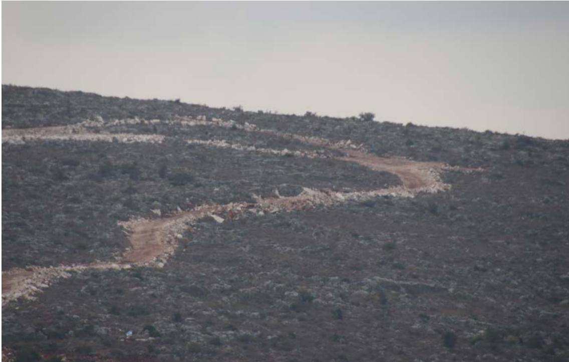
פריצת דרך על ידי מתנחלים בשטח אדמות הכפר א-דיק