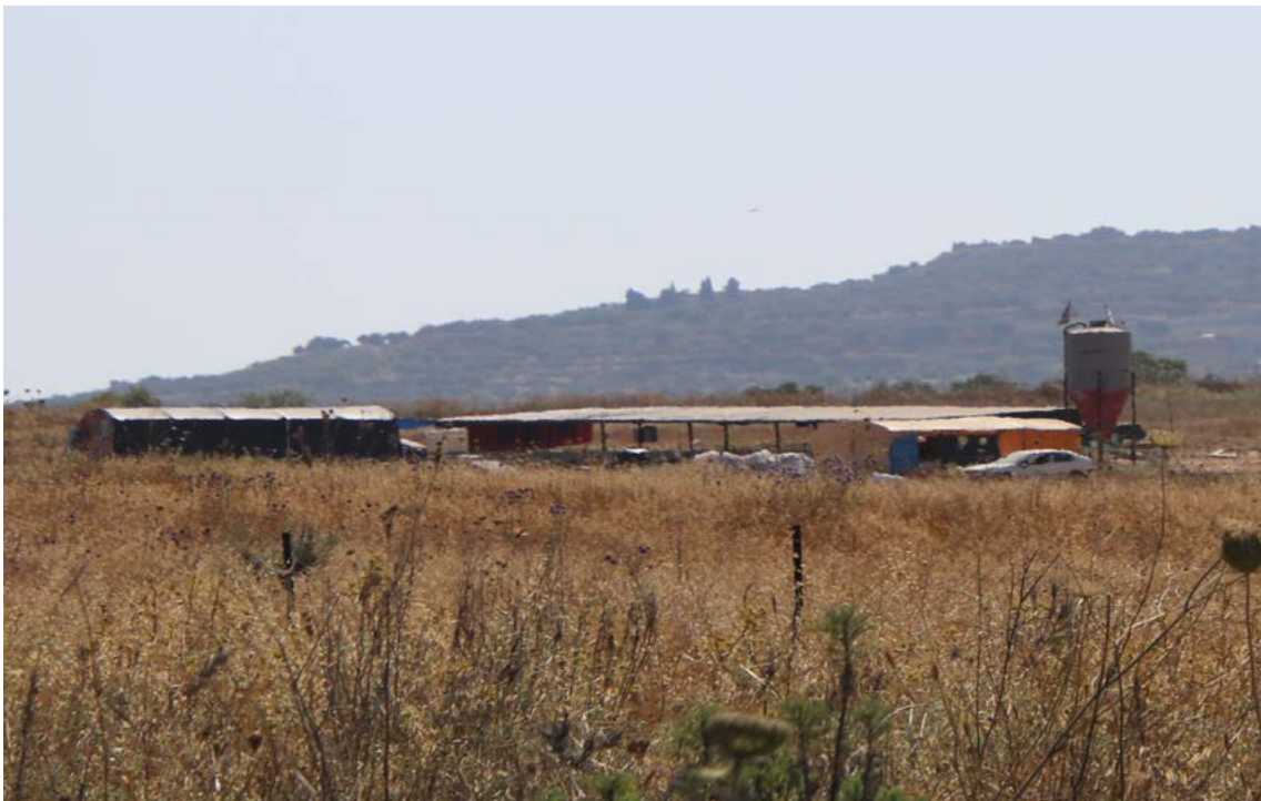
המאחז חוות אלחי ליד דיר שרף