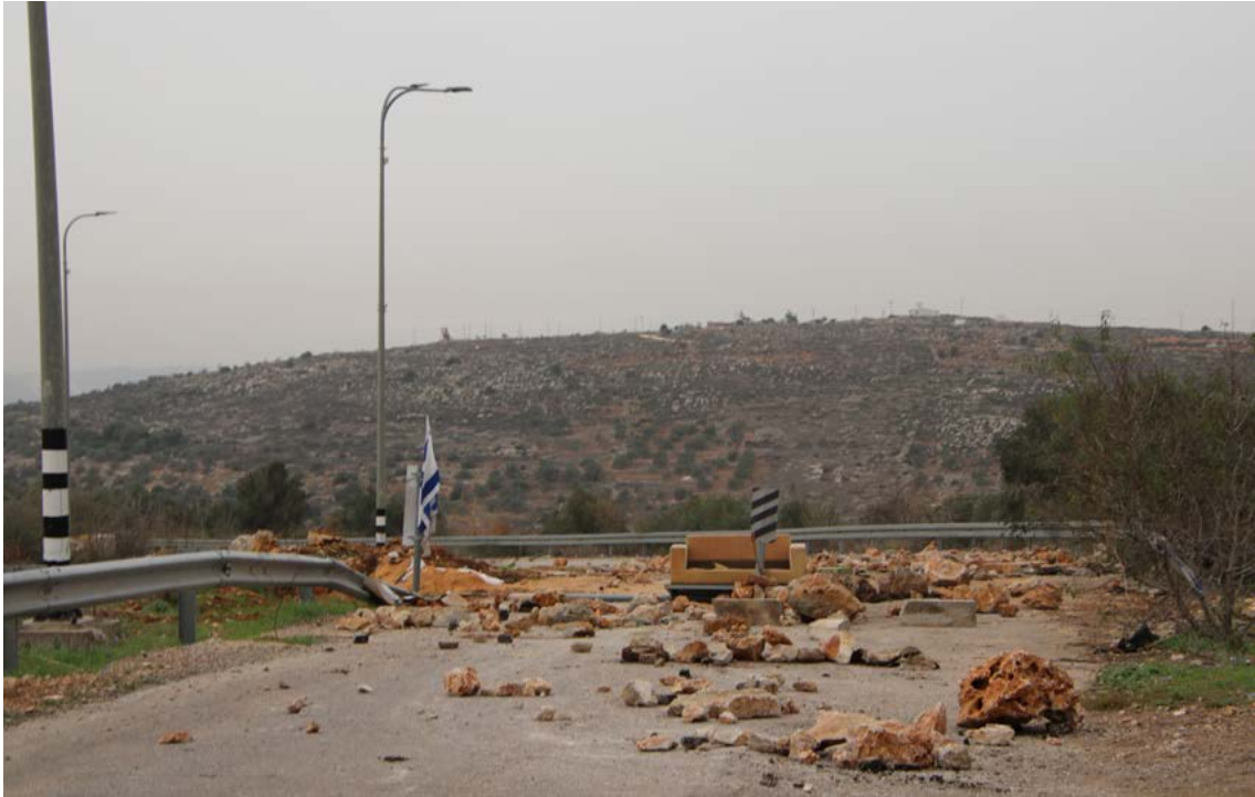
חסימת הדרך על ידי המתנחלים לכפר הפלסטיני יאסוף, ליד ההתנחלות תפוח