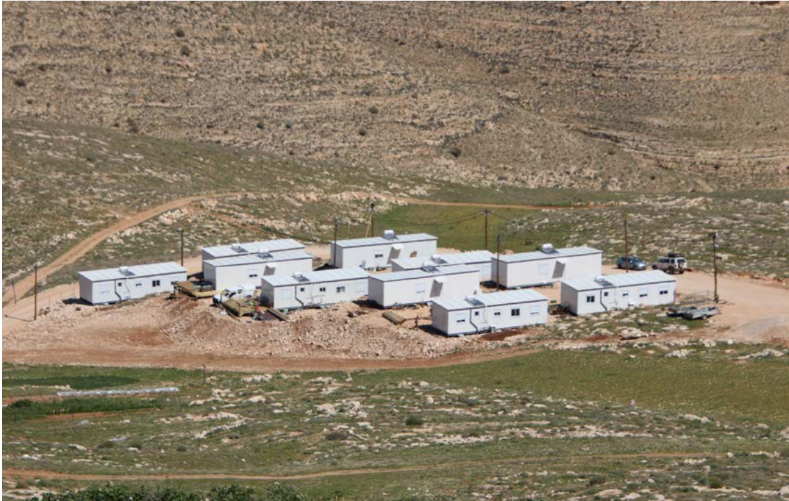
המאחז תקוע ו'