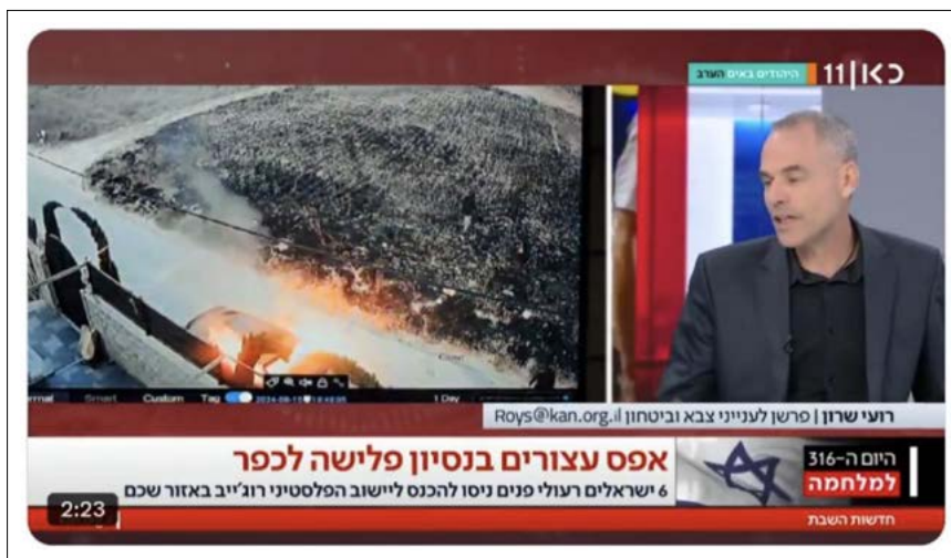
כתבה על אלימות מתנחלים בכפר ג'ית, אוגוסט 2024 וכשלי מערכת הביטחון