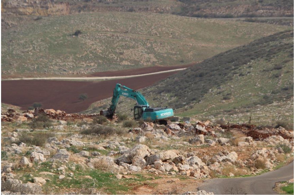
עבודות תשתית מזרחית להתנחלות איתמר