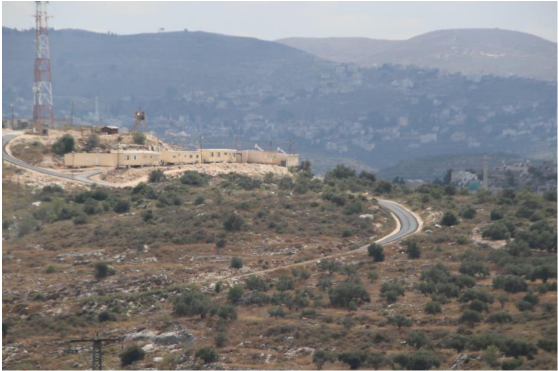
נופי אלחנן – אחד מ 25 המאחזים שהוקמו