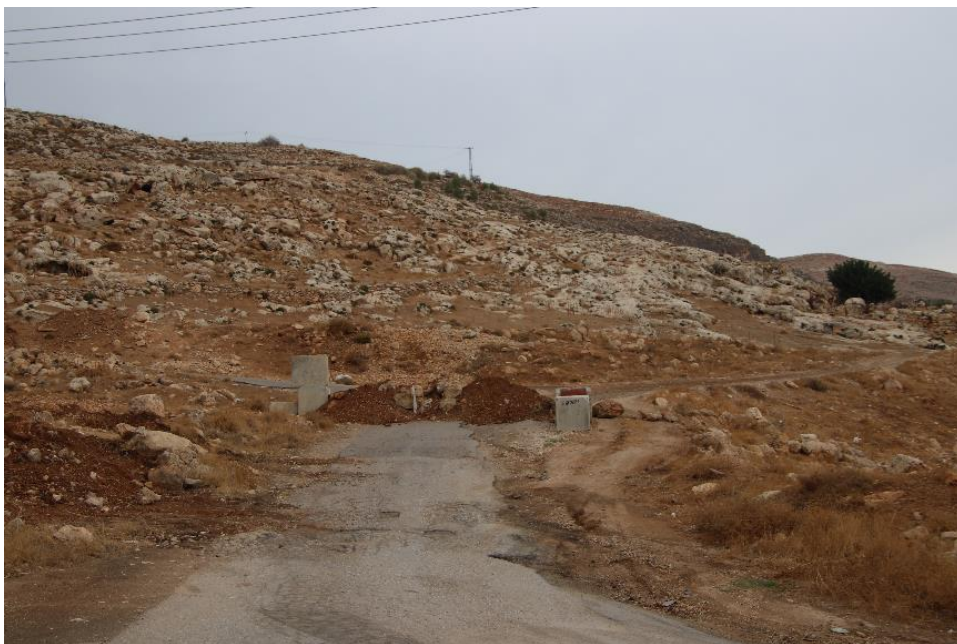
חסימת הכניסה לכפר עין סמיה, צפונית מזרחית לשכם