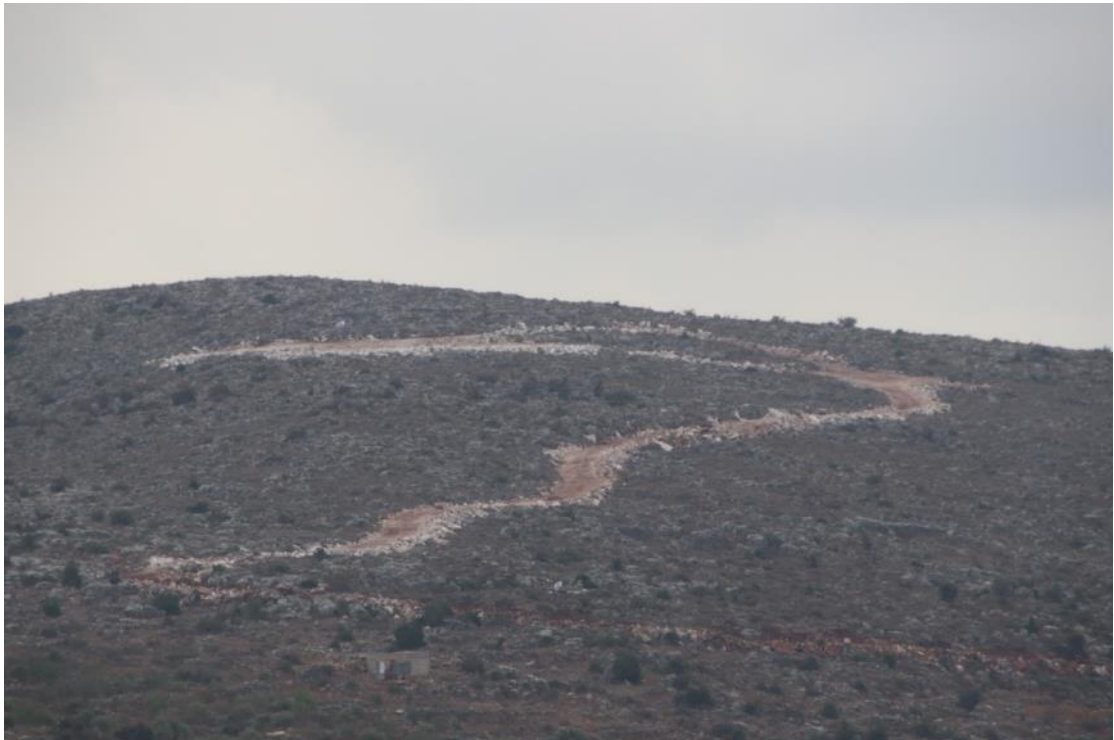
פריצת דרך על ידי מתנחלים בשטח אדמות הכפר א-דיק