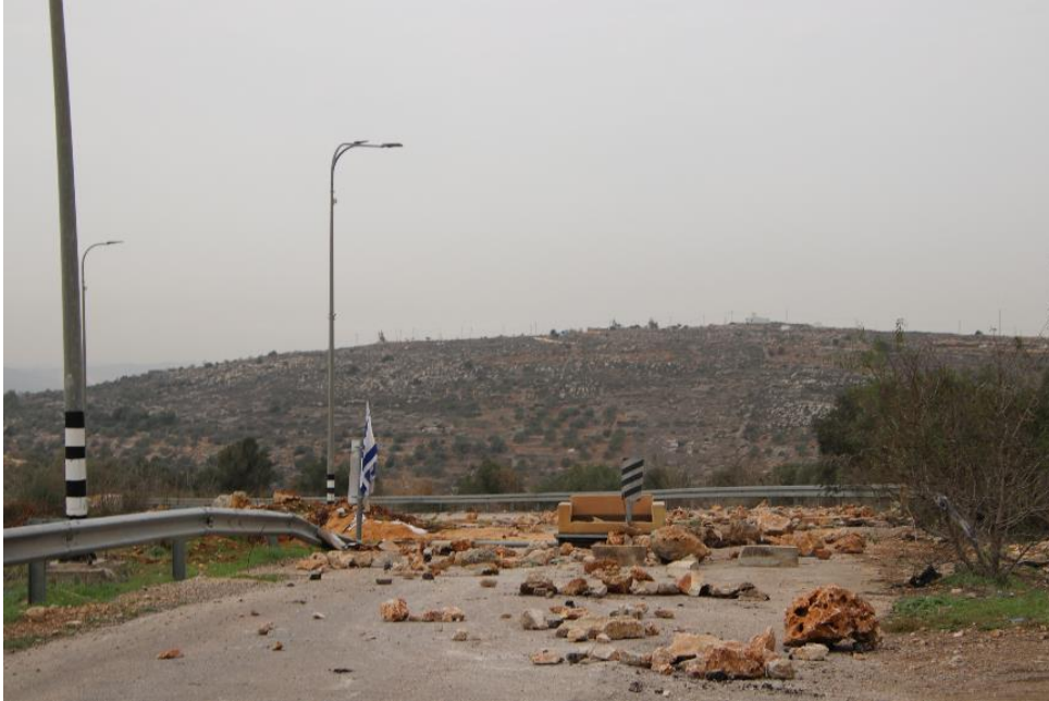
חסימת הדרך על ידי המתנחלים לכפר הפלסטיני יאסוף, ליד ההתנחלות תפוח

* נתוני אוצ'ה – משרד האו"ם תיאום עניינים הומניטריים