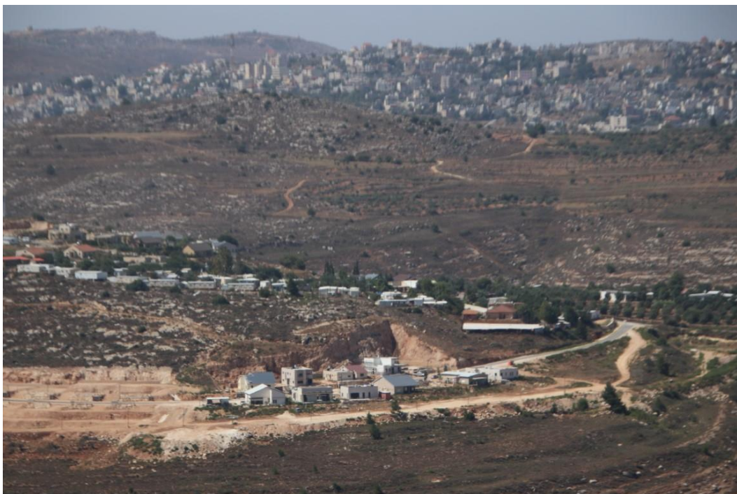
המאחז גבעת הראל