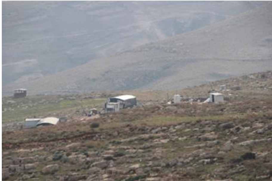
המאחז תקוע ו'

ב. קידום תוכניות בניה בגדה המערבית (ללא מזרח ירושלים) - בשנת 2023, ממשלת ישראל קידמה תוכניות לבניית 12,349 יחידות דיור (יח"ד) בהתנחלויות בגדה המערבית. תוכניות אלה אושרו להפקדה או למתן תוקף. להערכת שלום עכשיו מדובר בשיא שנתי לפחות מאז הסכם אוסלו. בנוסף, פרסם משרד השיכון מכרזים חדשים ל 1,289 יח"ד בגדה המערבית. במהלך חודש יוני, פורסמה להפקדה תכנית להקמת אזור תעשייה ענק של כ-2,700 דונם מדרום לקלקיליה, אזור תעשייה שער השומרון .