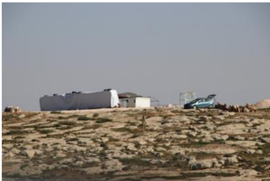
המאחז ממזרח לאביגיל