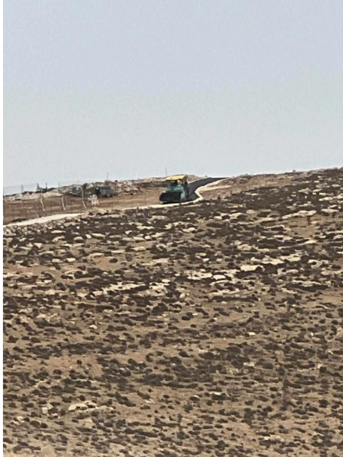
פריצת דרך למאחז החדש בגבולות הכפר בית עווא, אזור חברון

לצד פעולות אלו ניכרת תופעה של התערבות מתנחלים לא רק במהלכים פוליטיים אלא גם בפעולות בטחוניות וטקטיות של צה"ל. מתנחלים לא מסתפקים בניסיונות להשפיע על החלטות הצבא, דרך הדרג המדיני ודרך מפקדי הגזרות בשטח, אלא החלו לקבוע עובדות בטחוניות בשטח בניגוד לעמדת הצבא. לדוגמא: