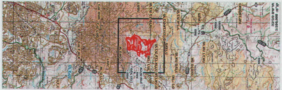
מפת 1:100,000 תחום גבעת עיטם. "אדסאק" - "מטבח אגמיה" - "ח' אל פלמ" - "תחום גבעת עיטם".