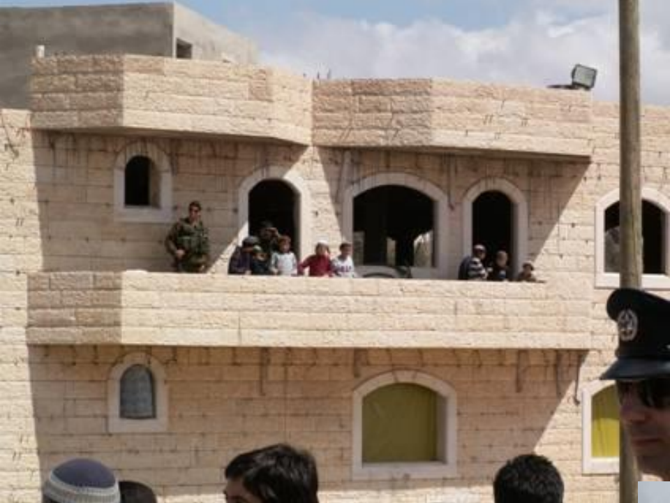
הבית באמת גדול – כ-4000 מ"ר

נוכחות קבועה של חיילים בתוך הבית כדי להגן על המתנחלים