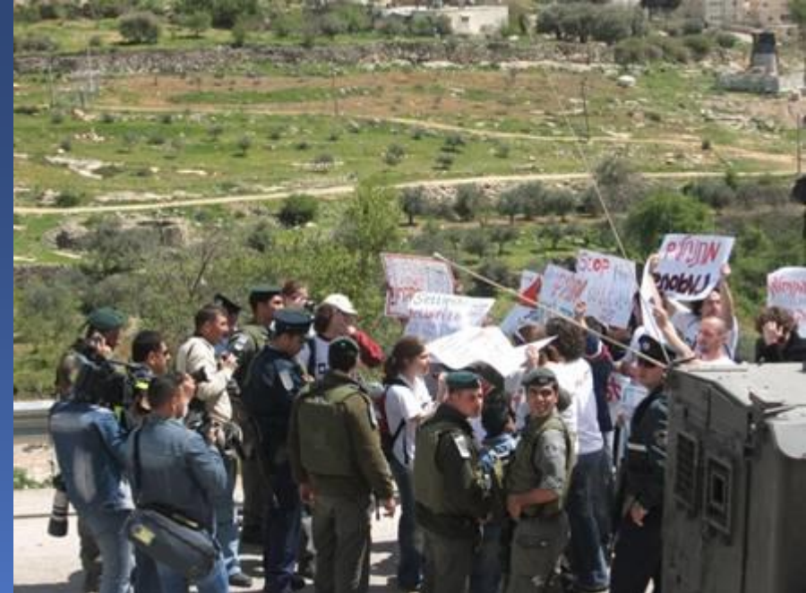
למרות הגבלות הצבא והמשטרה, פעילי שלום עכשיו מפגינים נגד ההתנחלות, 25.3.07