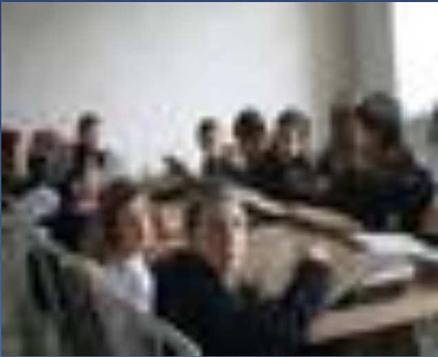
עשרות תלמידי ישיבה במבנה