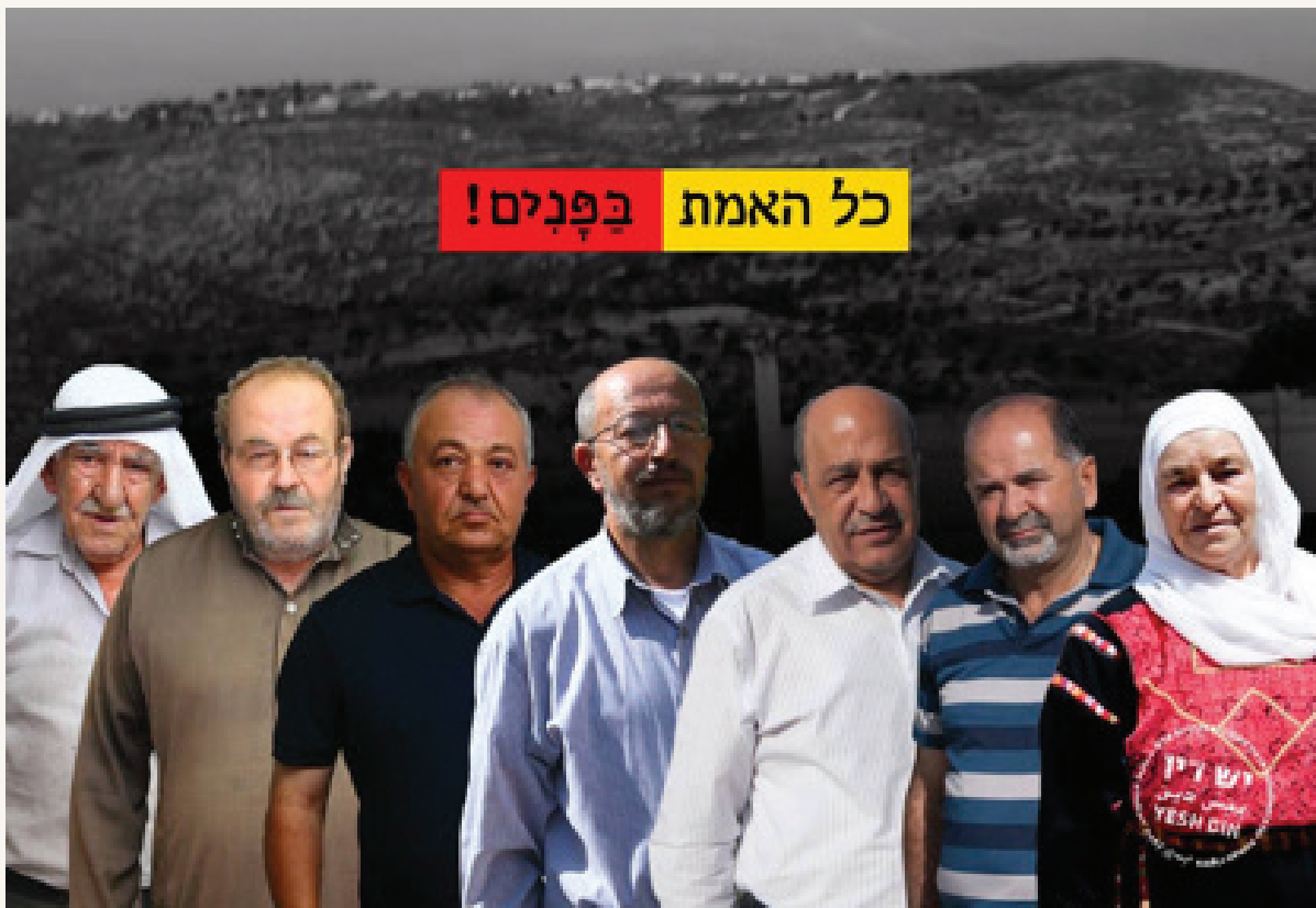
תמונת חלק מבעלי הקרקע העותרים לפינוי עמונה